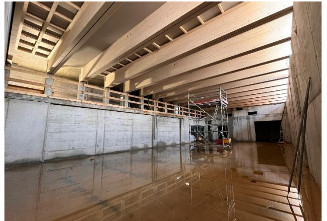
Neue Turnhalle innen