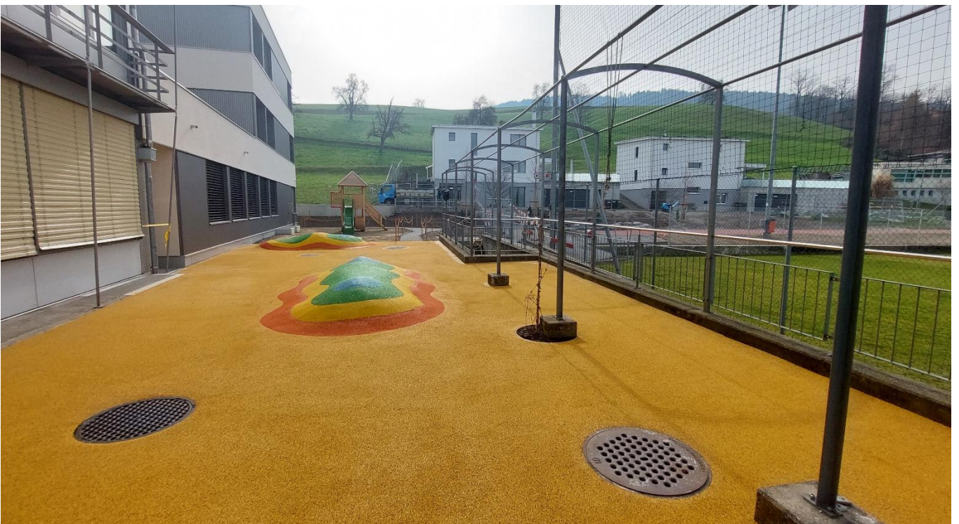
Neuer Spielplatz Kindergarten 1