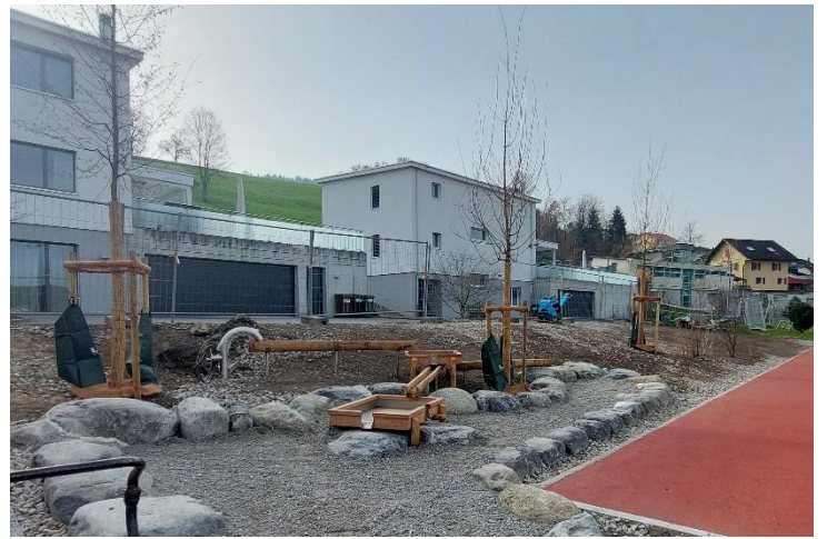
Wasserspiel bei Laufbahn