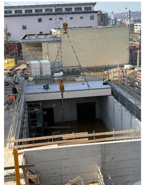
Dach wird auf Turnhalle gesetzt