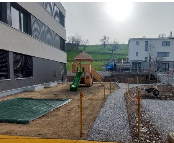
Neuer Spielplatz Kindergarten 2