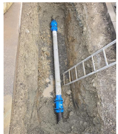
Leitungsbruch definitiv repariert