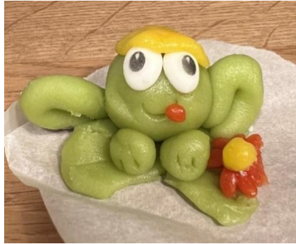
Eigenkreation von Livio