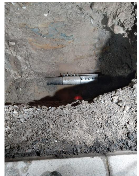
Leitungsbruch provisorisch repariert