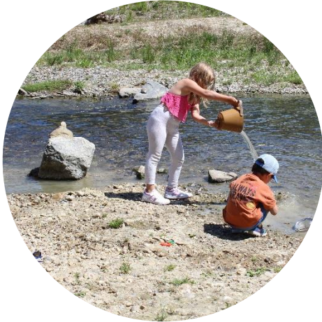
Baden an der Ron

Und wieder eine sehr gelungene Sommerferien-Betreuung in den TAS