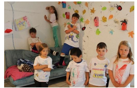
In den Tagesstrukturen